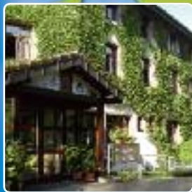
Centre de Jeunes Breisach PAYS DE BADE