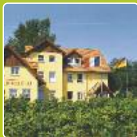
ADS Schullandheim Langholz MER BALTIQUE