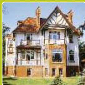
Centre de Jeunes Seebad Heringsdorf MER BALTIQUE