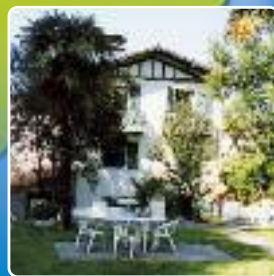
Villa Borda Zahar