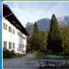
Centre de Jeunes Berchtesgaden HAUTE-BAVIÈRE