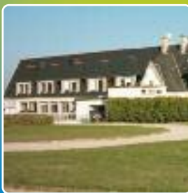
Club Léo Lagrange