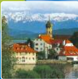
Deutsch-französisches Schülerheim Wasserburg LAC DE CONSTANCE